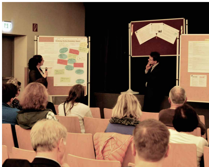
AUFTAKTVERANSTALTUNG AM 11. MÄRZ 2019 im SKZ Alberttreff.