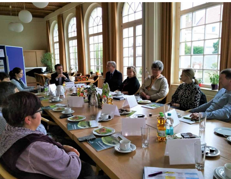
EINES VON VIER EXPERTENGESPRÄCHEN Anfang 2019 in Großenhain.